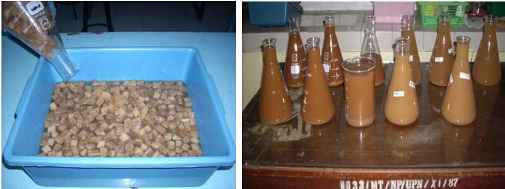
Gambar 2. Panen NEP ( Steinernema sp.)

Setelah diinkubasikan selama 14-21 hari, nematoda dapat dipanen. Hasil panen selanjutnya dibuat suatu formulasi.