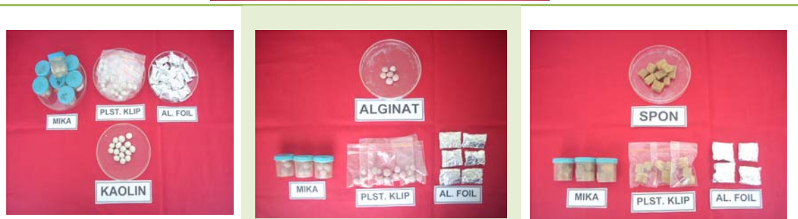
Gb. 3. Formulasi NEP dalam Kaolin, Alginat dan Spon