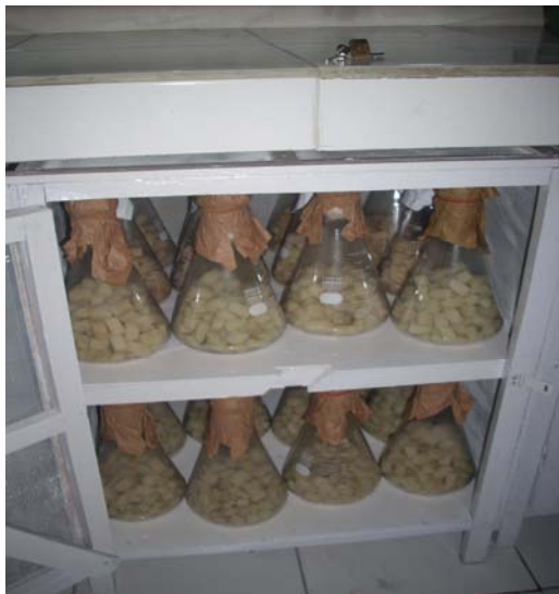
Gambar 1. Pembiakan Massal NEP ( Steinernema sp.)

Setelah bakteri simbion dan nematoda entomopatogen diinokulasikan pada media spon steril, selanjutnya diinkubasikan selama 14-21 hari. Selama masa inkubasi nematoda akan berkembang pesat dalam media tersebut. Pada saat pembiakan nematoda Steinernema spp. di dalam tabung Erlenmeyer , setelah 5 hari muncul nep membentuk jala-jala pada dinding tabung. Jala-jala tersebut adalah nematoda Steinernema spp. yang berkoloni, karena sifat dari nematoda Steinernema spp. adalah membentuk koloni. Selama masa in kubasi, kondisi lingkungan harus selalu disterilkan menggunakan alkohol 70% agar terhindar dari kontaminasi mikroorganisme lain.