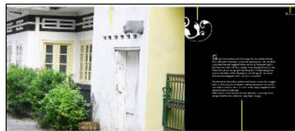
Gambar 2. Contoh kontras yang dipakai pada buku visual batik jetisan

Masing-masing elemen di halaman kami harus ada yang dominan. Anda dapat menonjolkan headlinenya, ilustrasi atau fotonya, maupun justru white spacenya. Jika semua elemen sama menonjolnya, maka mereka akan berebut mencari perhatian. Dalam pemilihan huruf, missalnya, penggunaan huruf tebal yang dikombinasikan dengan huruf tipis dapat menimbulkan kontras. Huruf berukuran besar jika disandingkan dengan huruf kecil juga akan menimbulkan kontras. Banyak yang dapat dilakukan untuk memadu objek agar muncul kontras sehingga diperoleh fokus perhatian.