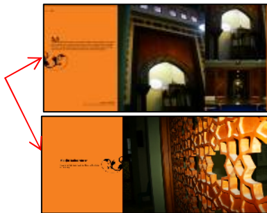
Gambar 3. Contoh perulangan yang dipakai pada buku visual batik jetisan

Dalam publikasi yang memiliki beberapa halaman, kontinuitas dari iramanya haruslah dijaga. Supaya diperoleh irama. Kami harus membuat beberapa elemen tetap yang diulang-ulang polanya. Dengan demikian, pembaca masih dapat mengikuti alur dari publikasi kami melalui ciri dari desain layout tersebut.